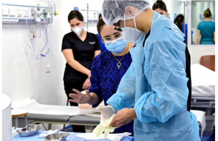
La docencia se ha desarrollado y fortalecido en el marco del Proyecto Educativo y el Modelo Formativo Institucional.

La permanente preocupación institucional ha estado marcada por alcanzar crecientes estándares de calidad desde diversos aspectos que conlleva la docencia, los que se han traducido en la implementación de mecanismos, en las distintas etapas de la formación de nuestros estudiantes, que garanticen el cumplimiento de la promesa formativa, así como un efecto positivo en los indicadores de retención, aprobación y tiempo de titulación. Entre ellos hay que destacar la innovación en el diagnóstico inicial y en el acompañamiento a los nuevos estudiantes; la implementación de mayo-