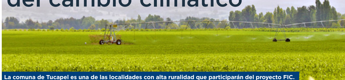
La comuna de Tucapel es una de las localidades con alta ruralidad que participarán del proyecto FIC.

Chile no está ajeno a los efectos y consecuencias del cambio climático, y en ese escenario surgió el proyecto Innovación Municipal Territorio Biobío Cordillera , liderado por Vinculación con el Medio (VcM) de la sede Concepción en conjunto con la Fundación Huella Local, que obtuvo financiamiento del Fondo de Innovación para la Competitividad (FIC), del Gobierno Regional del Biobío. El proyecto se ejecutará en las comunas precordilleranas Alto Biobío, Quilleco, Antuco, Santa Bárbara, Quilaco y Tucapel, que poseen un alto nivel de ruralidad. “Esta intervención,