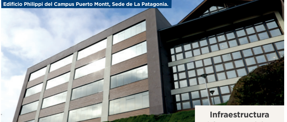
Edificio Philippi del Campus Puerto Montt, Sede de La Patagonia.

La Universidad está en proceso de Re-acreditación Institucional, instancia que permite dar cuenta de los importantes avances que se han logrado en las áreas de gestión institucional, docencia y vinculación con el medio en el periodo 2016-2021.