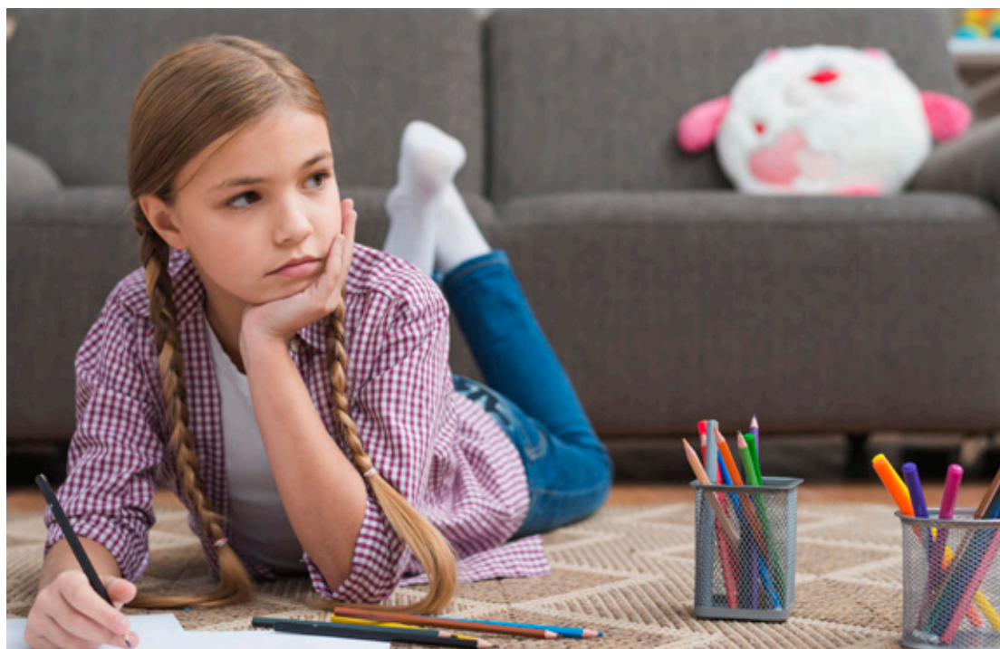
Durante la pandemia se vuelve muy difícil sobrellevar el encierro y los niños y adolescentes pierden el espacio social que les brindaban los establecimientos educacionales.

Proyecto colaborativo de Vinculación con el Medio, liderado por la carrera de Psicología, implementó atenciones a distancia a niños, niñas y adolescentes.