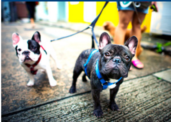
El proyecto busca superar la meta de 200 mascotas atendidas en la comuna de Puerto Montt.

tudiantes de la carrera para la comunidad y finalmente, se llevarán a cabo distintos operativos de implementación de microchip y vacunación, en el cual buscamos superar la meta de 200 mascotas atendidas en la comuna de Puerto Montt”, explica el Dr.