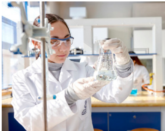
La acreditación facultará al Comité a profundizar en los fundamentos del Humanismo Cristiano desde la investigación.

Los avances que genera la ciencia hace necesario resguardar que la investigación cumpla con las normas éticas y bioéticas establecidas, así como cautelar los derechos de las personas y sujetos sometidos a estudio.