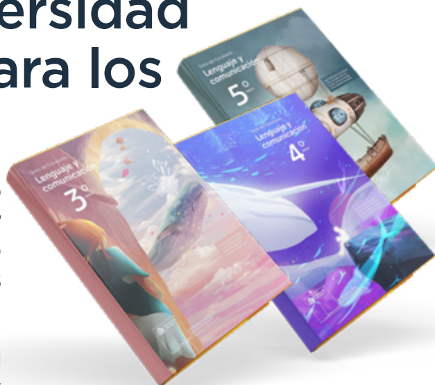
Portadas de referencia de los textos escolares que participaron en la licitación oficial para Lenguaje y Comunicación de Tercero, Cuarto y Quinto Básico.

La Facultad de Ciencias de la Educación se adjudicó por primera vez, la licitación para confeccionar los textos escolares de Tercero, Cuarto y Quinto Año Básico para estudiantes de establecimientos públicos y particulares subvencionados.