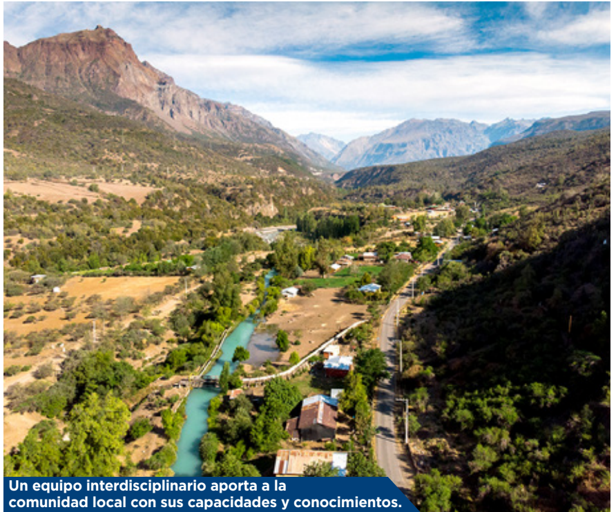
Un equipo interdisciplinario aporta a la comunidad local con sus capacidades y conocimientos.

Producto de los efectos que la pandemia ha generado en la industria turística, académicos y estudiantes identificaron nuevas necesidades de las Pymes que forman parte de la ruta.