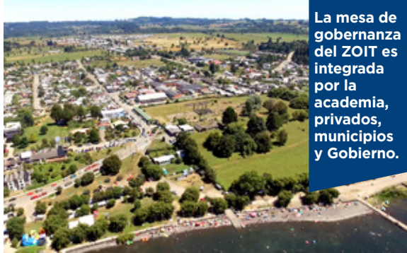
La mesa de gobernanza del ZOIT es integrada por la academia, privados, municipios y Gobierno.

Profesionales de la Universidad trabajarán durante cuatro meses en la generación de diseños metodológicos que fortalezcan el desarrollo sostenible en las comunas de Río Bueno, Puyehue y Puerto Octay.