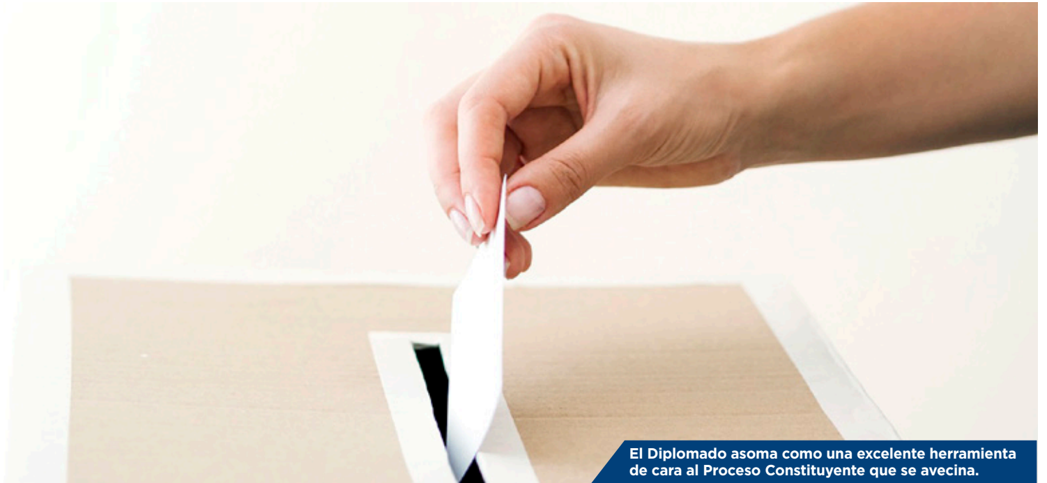
El Diplomado asoma como una excelente herramienta de cara al Proceso Constituyente que se avecina.

Programa de la Escuela de Gobierno está dirigido a candidatos a la Convención Constituyente, a docentes universitarios, periodistas y a quienes están comprometidos con la participación ciudadana.