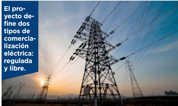
El proyecto define dos tipos de comercialización eléctrica: regulada y libre.

El objetivo de la iniciativa es establecer el derecho a que los usuarios puedan elegir su suministrador, a través de la introducción de modificaciones a la Ley General de Servicios Eléctricos.