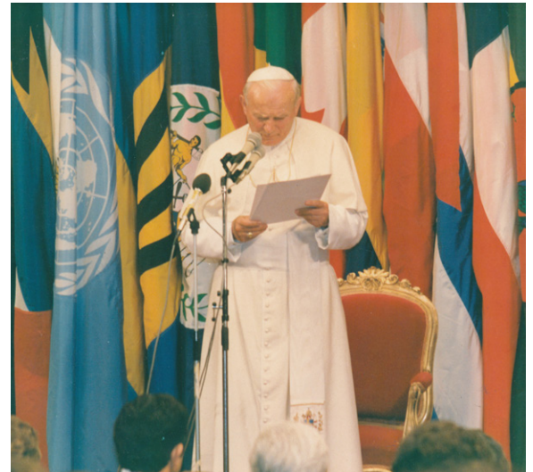
El 1987, el Papa Juan Pablo II ofreció un recordado discurso en la Cepal. En estos días, cobra especial valor.

sentir el dolor ajeno como propio y de prepararse con decisión para superar la crisis económica que viene. En todos esos problemas, el factor humano resulta fundamental, como lo deben comprender la medicina y la política; la economía y las relaciones internacionales, que deben ponerse al servicio de la persona humana, como instrumentos indispensables