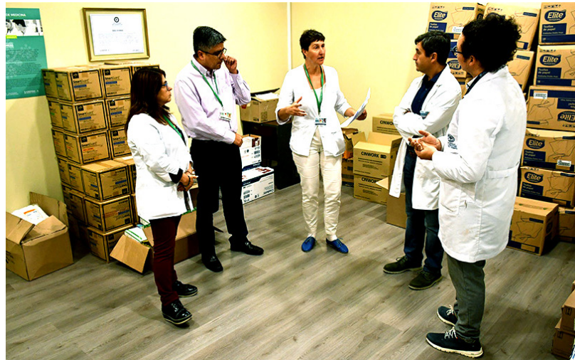
Las donaciones han sido posibles gracias a la coordinación de las facultades del área de la Salud.

Entre los elementos entregados se encuentran mascarillas, jabón y pecheras, entre otros insumos aportados por las facultades del área de la Salud.